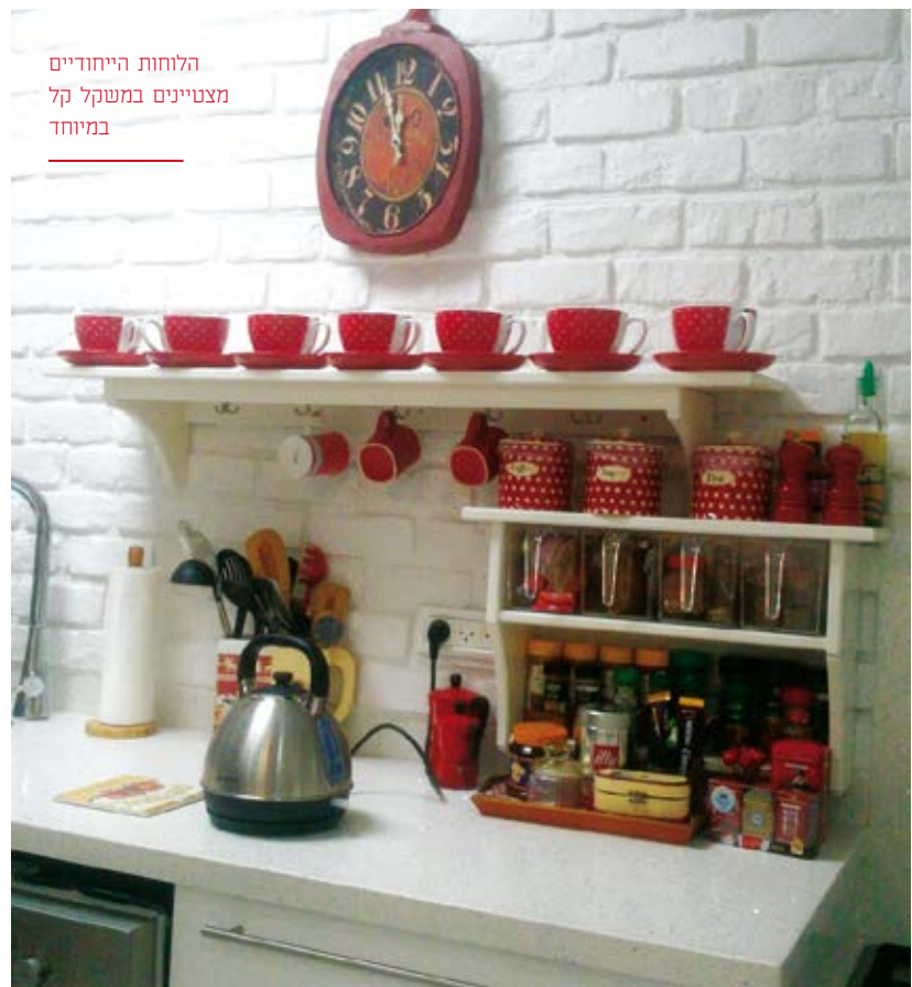
הלוחות הייחודיים מצטיינים במשקל קל במיוחד

החיפוי מגיע בלוחות בגודל של כמ"ה המאפשרים לחפות שטחי כיסוי גדולים במינימום זמן ומבטלים את הצורך להתקין "בריק-בריק". הלוחות בעלי משקל קל במיוחד (כחמישית מאבן אמיתית ואף פחות מכך) ואף מאפשרים התקנה על גבי כל תשתית ישרה, כולל גבס. התקנת החיפוי קלה ופשוטה, ונעשית באמצעות הדבקה. וכמובן, יתרון הולם במיוחד הוא ההתאמה האישית, בזכות העובדה שניתן להזמין את מוצרי החיפוי הללו במגוון צבעים רחב. כדאי לדעת כי אופן ההתקנה אינו מצריך ידע וניסיון קודם. למעשה, כל אחד ואחת יכולים להתקין את החיפוי בעצמם ולחסוך את עלויות ההתקנה. באשר ליתרונות המוצר - החיפוי עשוי מפוליאורטן מוקצץ, חומר אשר ידוע כמבודד תרמי מעולה העוזר לשמור על טמפרטורה קבועה בבית. הוא גם מצטיין בחוזק ובעמידות לאורך שנים. זאת ועוד: מעל הפוליאורטן ישנו ציפוי טיח אקרילי מיוחד, שמקשיח אותו עוד יותר ומעניק תחושה ומראה של אבן. כל החיפויים נצבעים ידנית בשיטת צביעה ייחודית המעניקה מראה טבעי ומרשים. במילים פשוטות, עיצוב הבית מעולם לא היה כה קל. באתר החברה www.kalkir.co.il